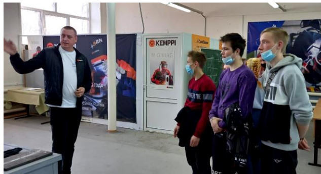
Обучающиеся 10 класса на экскурсии в Вичугском многопрофильном колледже