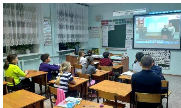
Просмотр материалов XIII краеведческая конференция «Иваново - город трудовой доблести»

Для развития детского самоуправления в школе создана детская организация «Радуга», работает Совет командиров.