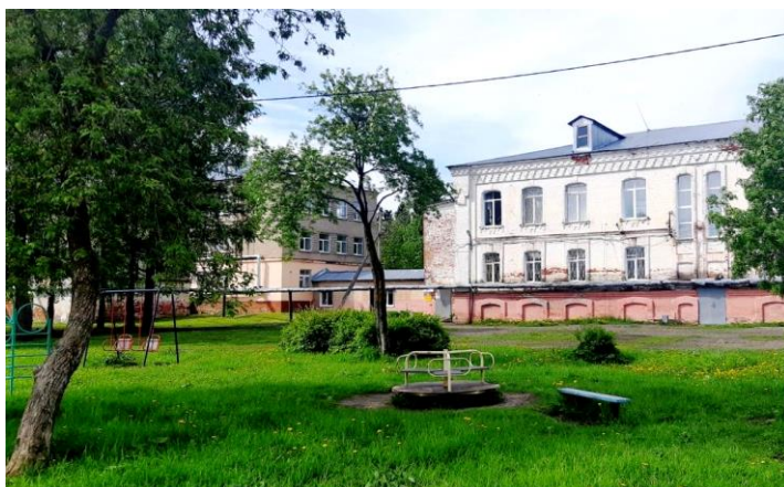
Территория образовательной организации