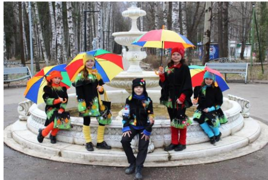
Коллекция Театра моды «Весенняя капель»