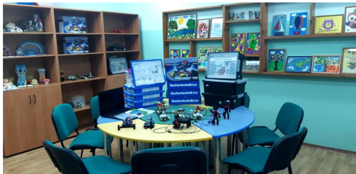
Кабинет дополнительного образования

В связи со сложившейся эпидемиологической обстановкой в ноябре-декабре 2020г. для обучающихся 9-10 классов обучение по дополнительным общеобразовательным общеразвивающим программам проходило в дистанционном формате.