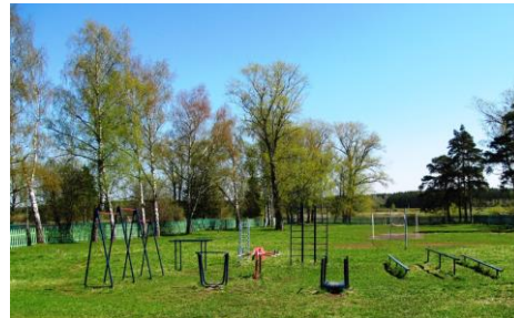
Спортивный зал, тренажерный зал, уличная спортивная площадка