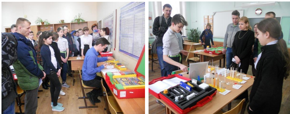
Презентация оборудования кабинетов физики, химии, биологии

Для уроков биологии приобретены наборы для проведения фронтальных и групповых исследований «Основы биологического практикума», «Типы почв и рост растений», «Мое тело, мое здоровье», мобильный лабораторный комплекс для учебной практической и проектной деятельности по естествознанию, набор для экспериментирования «Эколаб», метеостанция.