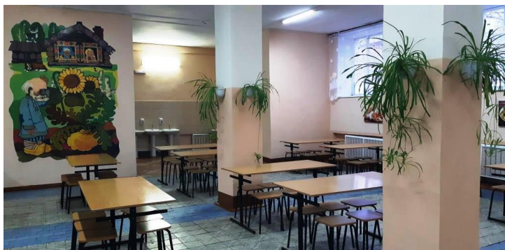
Обеденный зал столовой

В условиях распространения новой коронавирусной инфекции COVID-2019 во II четверти 2020-2021 учебного года во время дистанционного обучения в учебные дни обучающимся 9-10 классов предоставлялись продуктовые наборы. В состав продуктовых наборов входили нескоропортящиеся продукты питания, согласованные Роспотребнадзором. Родители (законные представители) обучающихся получали продуктовые наборы в образовательной организации в соответствии с утвержденным графиком.