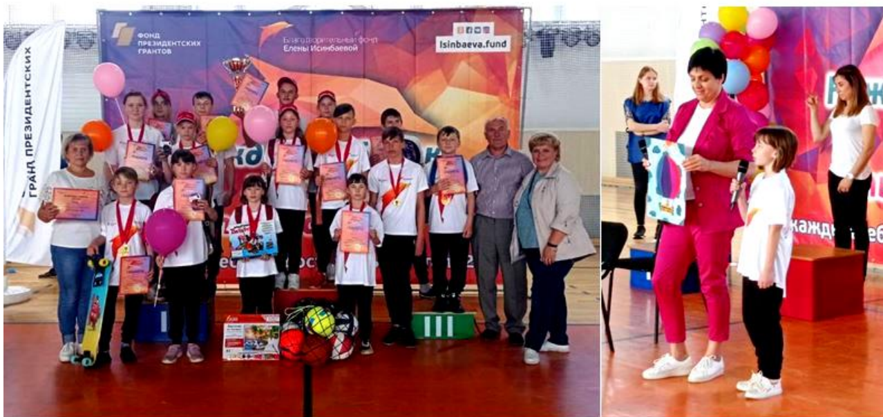
Победа на региональном спортивном празднике «Каждый ребенок достоин пьедестала»

По итогам участия в 2020-2021 учебном году в региональном спортивном празднике «Каждый ребенок достоин пьедестала», организованном благотворительным фондом Елены Исинбаевой, обучающиеся ОГКОУ «Вичугская коррекционная школа-интернат № 1» заняли I общекомандное место и 13 призовых мест в личном первенстве в виде программы «Многоборье ГТО» и завоевали путевку для участия в Межрегиональном празднике, который будет проходить в сентябре 2021г. в городе Волгограде.