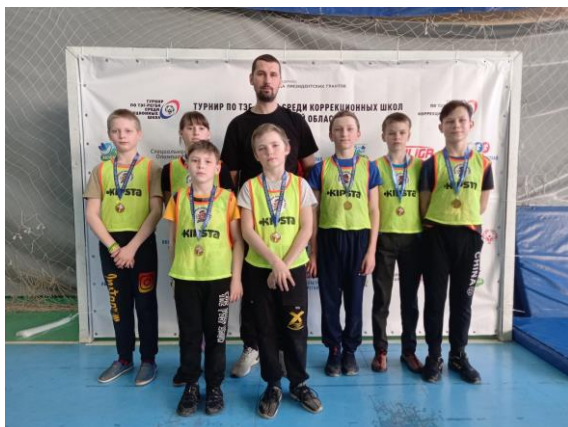
Команда младшей возрастной группы

Фондом президентских грантов. На турнире в младшей возрастной группе (10-13 лет) команда ОГКОУ «Вичугская коррекционная школа-интернат № 1» заняла II место, в старшей возрастной группе (14-16 лет) - I место.