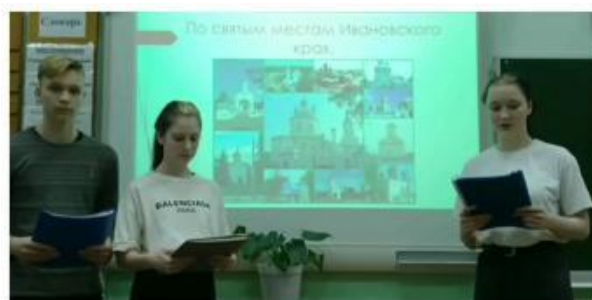
Презентация материалов XIV краеведческой конференции «Культурный дневник школьника»