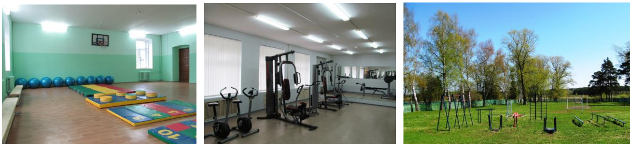
Спортивный зал, тренажёрный зал, уличная спортивная площадка

Школьный кабинет ОБЖ оборудован интерактивным лазерным стрелковым тренажером «Лазер-СТК» и программой «Виртуальный тир».