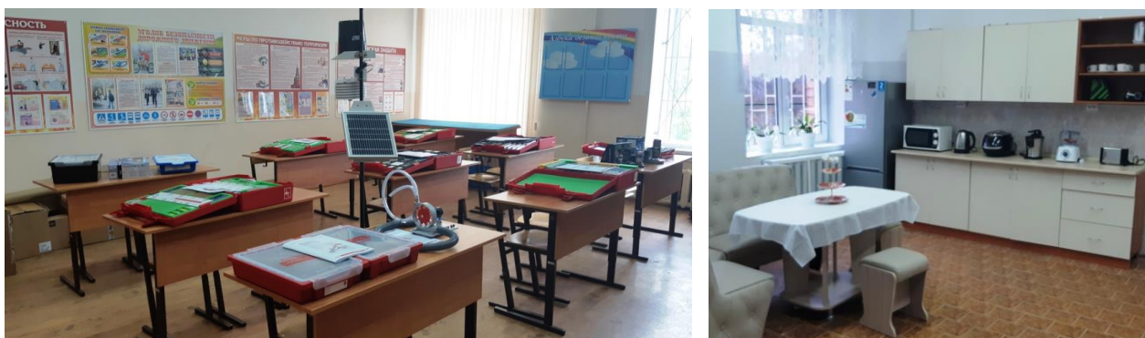
Оборудование кабинетов физики, химии, биологии, технологии

Для уроков биологии приобретены наборы для проведения фронтальных и групповых исследований «Основы биологического практикума», «Типы почв и рост растений», «Мое тело, мое здоровье», мобильный лабораторный комплекс для учебной практической и проектной деятельности по естествознанию, набор для экспериментирования «Эколаб», метеостанция.