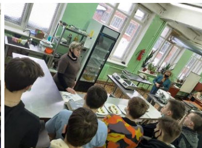
Обучающиеся 10 класса на экскурсии в Вичугском многопрофильном колледже