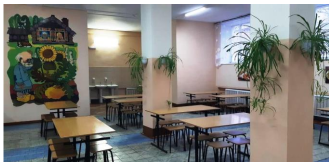
Обеденный зал столовой

В школьной столовой имеется весь необходимый набор помещений для приготовления пищи. Пищеблок полностью укомплектован необходимым оборудованием для обработки сырья, приготовления пищи, ее раздачи, сбора и мытья посуды, имеется обеденный зал на 80 посадочных мест.