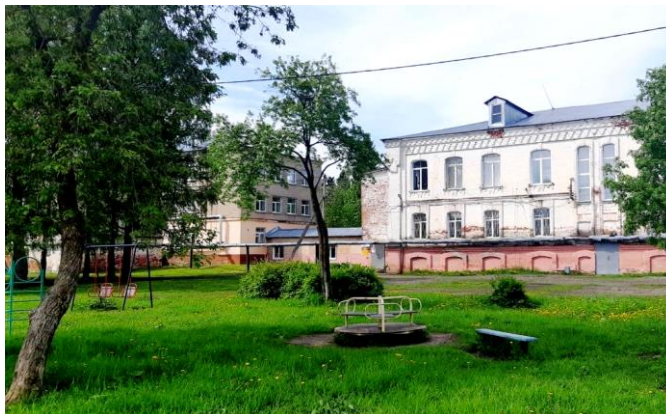
Территория образовательной организации