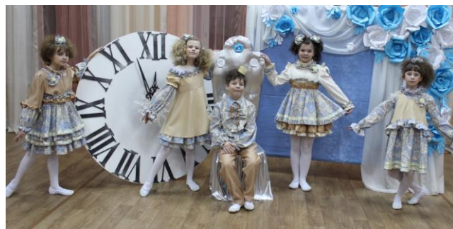
Коллекция Театра моды «На балу у принца»

Образовательная деятельность по дополнительным общеобразовательным общеразвивающим программам направлена на формирование и развитие творческих способностей обучающихся, формирование культуры здорового и безопасного образа жизни, обеспечение духовно-нравственного, гражданско-патриотического, трудового воспитания обучающихся, профессиональную ориентацию, социализацию и адаптацию обучающихся к жизни в обществе, формирование общей культуры обучающихся.