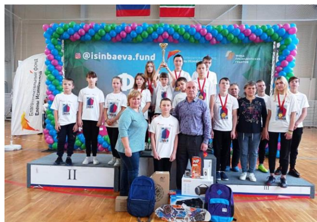
В Финале Межрегионального этапа проекта

В 2022 году ОГКОУ «Вичугская коррекционная школа-интернат № 1» стала участником спортивного проекта «ТЭГ-РЕГБИ — новый вид спорта для коррекционных школ Ивановской области», реализуемом Федерацией регби Ивановской области с использованием гранта Президента Российской Федерации на развитие гражданского общества, предоставленного