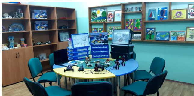
Кабинет дополнительного образования