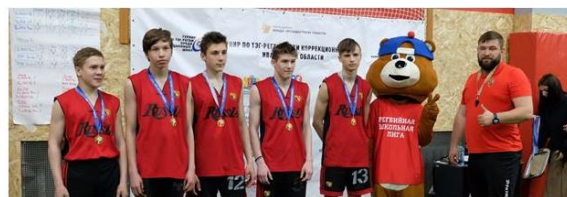
Команда старшей возрастной группы

Школьный театр моды «Надежда» был приглашен для выступления на XIV Фестиваль детских театров моды в рамках XVI Международного фестиваля моды «Плес на Волге. Льняная палитра» и награжден за общее впечатление художественной выразительности коллекции специальным призом фестиваля.