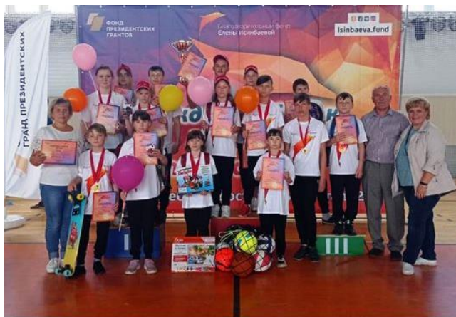
На региональном этапе проекта

Финал Межрегионального этапа соревнований проходил осенью 2021г. в городе Казани среди 11 команд из Ивановской, Ярославской, Владимирской, Нижегородской областей, Волгограда и Республики Башкортостан. Команда Вичугской школы-интерната № 1 заняла II место в общекомандном зачете в многоборье с элементами ГТО, уступив только юным спортсменам из Волгограда. В личном первенстве призерами и победителями спортивных испытаний стали 7 обучающихся школы-интерната.