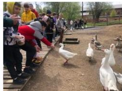
Поездка в эко парк «Парк Добрый»