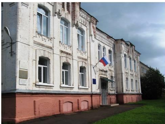
Здание учебного корпуса