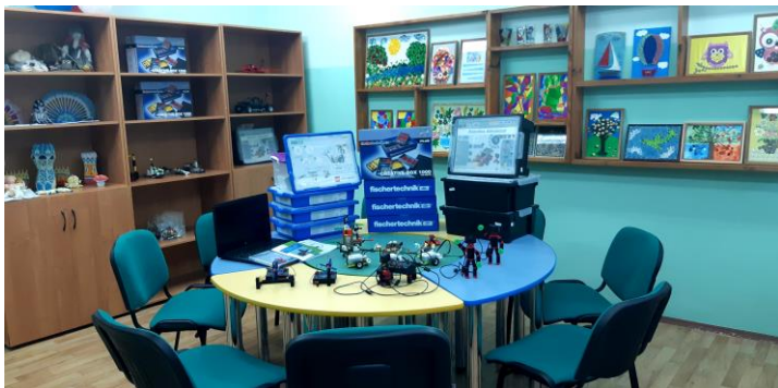
Кабинет дополнительного образования