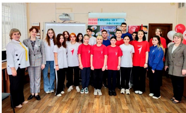
Торжественная церемония вступления в Движение Первых