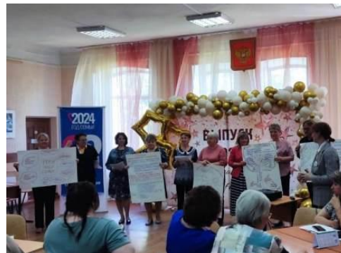
Проектная сессия по сохранению российских духовно-нравственных ценностей