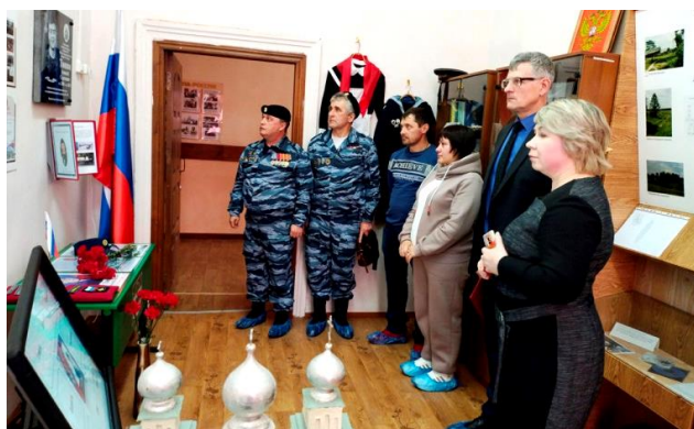
Открытие в школьном музее экспозиции памяти А.С. Тюпина

При формировании экспозиции применены современные подходы и использовано мультимедийное интерактивное оборудование для демонстрации презентаций, видеофильмов и музыкального сопровождения во время проведения экскурсий, уроков мужества, патриотических акций.