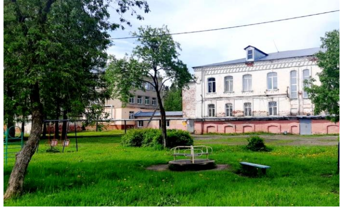
Территория образовательной организации