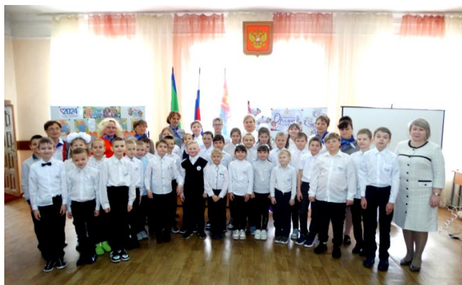
Торжественное посвящение в Орлята России