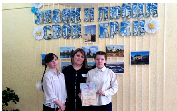
На IV областном конкурсе краеведческих проектов «Знаем и любим свой край»

В образовательной организации имеется пришкольный участок площадью 2,5 гектара, ведется работа по развитию социальной компетентности обучающихся через привлечение их к сельскохозяйственному труду.