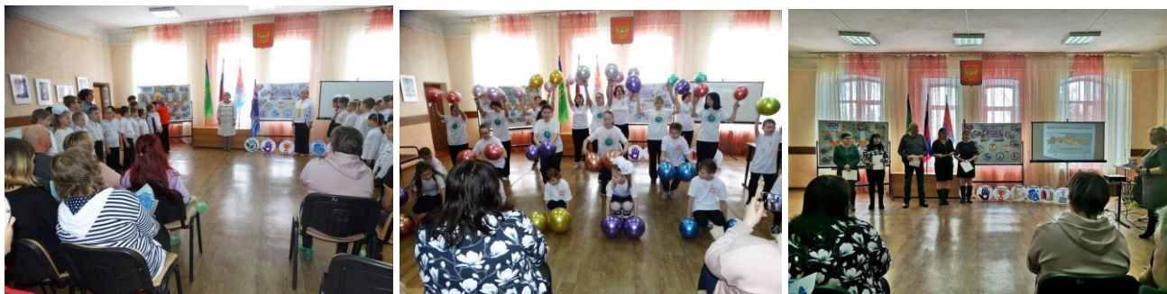
День открытых дверей «Семья и школа – взгляд в одном направлении»

В марте 2024 года в Вичугской коррекционной школе-интернате № 1 для родителей (законных представителей) обучающихся 1-10 классов прошел День открытых дверей «Семья и школа — взгляд в одном направлении», посвященный Году семьи в Российской Федерации.