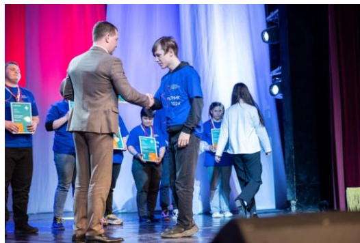
Награждение на чемпионате «Абилимпикс»