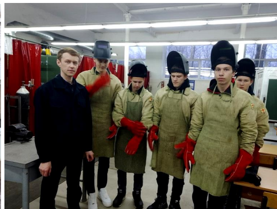
Обучающиеся 10-х классов на экскурсии в Вичугском многопрофильном колледже