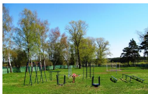
Уличная спортивная площадка