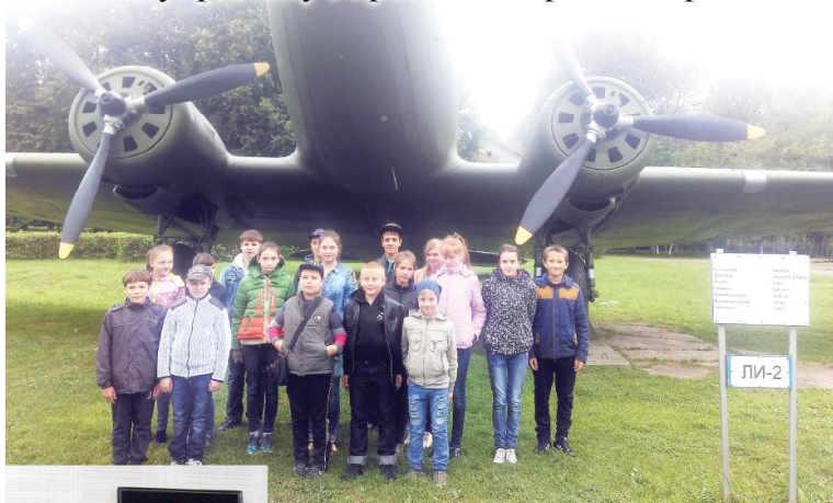
Перед началом учебного года школьники посетили музей военно-транспортной авиации и стали участниками праздника «Полёт к знаниям».