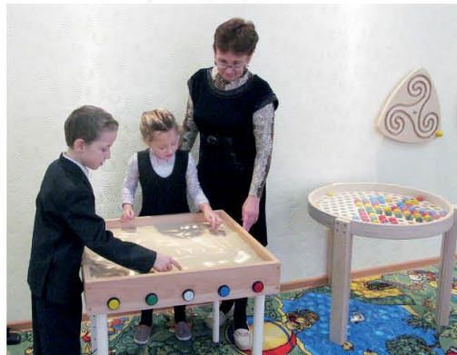
Коррекционное занятие учителя-дефектолога.

- Я пришла в эту школу пионервожатой, окончив Ивановское педагогическое училище, -