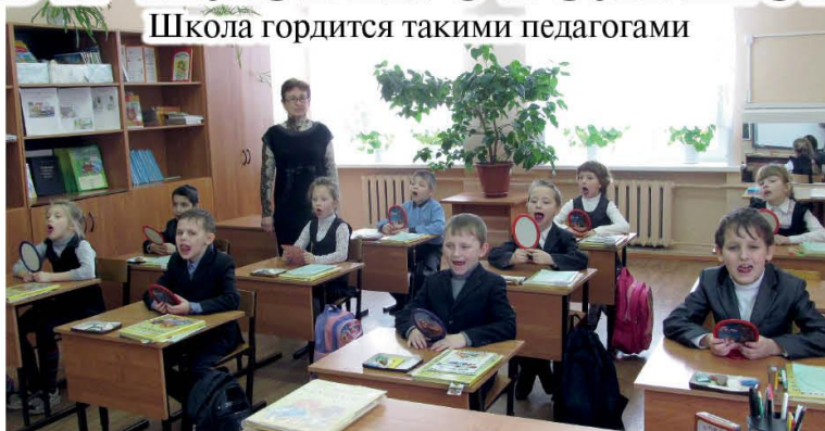
На уроке проношения в первом классе.

За эти годы, конечно, изменились и учитель, и ученики, следуя запросам времени и общества. Тенденция образования сегодня - не только дать знания, сформировать умения и навыки, но и научить детей адаптироваться в современном мире. Ключевая задача педагогов - развитие личности, в том числе совершенствование коммуникативных навыков, осознанный выбор здорового образа жизни, понимание патриотизма и то-